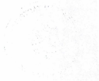
Bc. Šárka Lančí správní referent

Odvolání se podává s potřebným počtem stejnopisů tak, aby jeden stejnopis zůstal správnímu orgánu a aby každý účastník dostal jeden stejnopis. Nepodá-li účastník potřebný počet stejnopisů, vyhotoví je správní orgán na náklady účastníka.