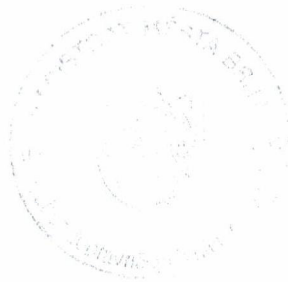
Bc. Šárka Lančí správní referent

Odvolání se podává s potřebným počtem stejnopisů tak, aby jeden stejnopis zůstal správnímu orgánu a aby každý účastník dostal jeden stejnopis. Nepodá-li účastník potřebný počet stejnopisů, vyhotoví je správní orgán na náklady účastníka.